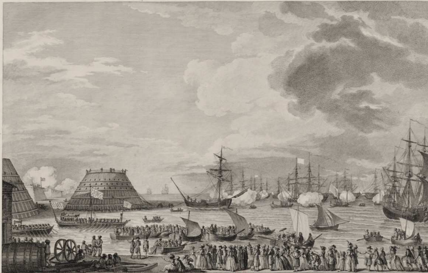
DÉPART D'UNE CAISSE CONIQUE EN PRÉSENCE DE SA MAJESTÉ LOUIS XVI, A CHERBOURG, LE XXIII JUIN M.DCC.LXXXVI.

molibus undas Obstruit, & latum dejectis rupibus æquor.